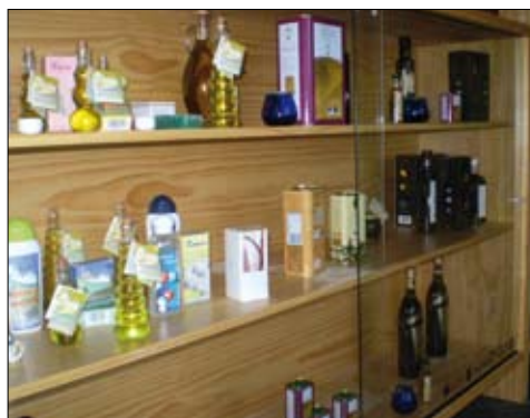
Interior de la agrotienda.

La inauguración de sede coincidió con la apertura de la agrotienda situada en las propias instalaciones. Este espacio ha sido posible gracias al proyecto Patrimonio Oleícola y labelización de agrotiendas de la ADR Sierra Mágina a través del proyecto 'Patrimonio Oleícola y labelización de agrotiendas', y comercializará todos los aceites de oliva virgen extra de la DO en formatos de vidrio y lata, así como otros productos de la comarca, como cosméticos y jabones a base de aceite de oliva, cerámicas o conservas.