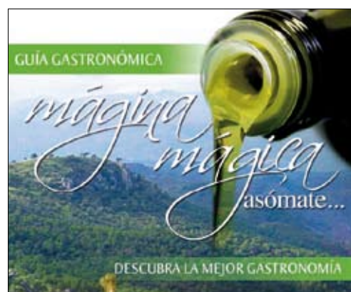
Portada de la publicación.

La Asociación para el Desarrollo Rural (ADR) Sierra Mágina ha editado una guía de establecimientos turísticos y de hostelería de la comarca, en la que ha incluido un catálogo con las marcas de aceite de oliva virgen extra amparadas por la Denominación de Origen con todos los datos para que los turistas puedan adquirir el producto. La guía fue presentada en la feria de turismo interior Tierra Adentro de Jaén y se han editado 5.000 ejemplares, con formato de bolsillo para su mayor facilidad en el uso por los visitantes de la comarca.