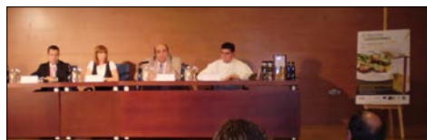
Mesa presidencial en la presentación de la Muestra Gastronómica.

El objetivo de las jornadas es llevar a Jaén lo mejor de la gastronomía de Sierra Mágina, fundamentado por el genuino aceite de oliva virgen extra producido con el esfuerzo de los más de 13.000 olivicultores integrados en la Denominación de Origen, a la vez que se refuerza la actividad con distintos talleres formativos.