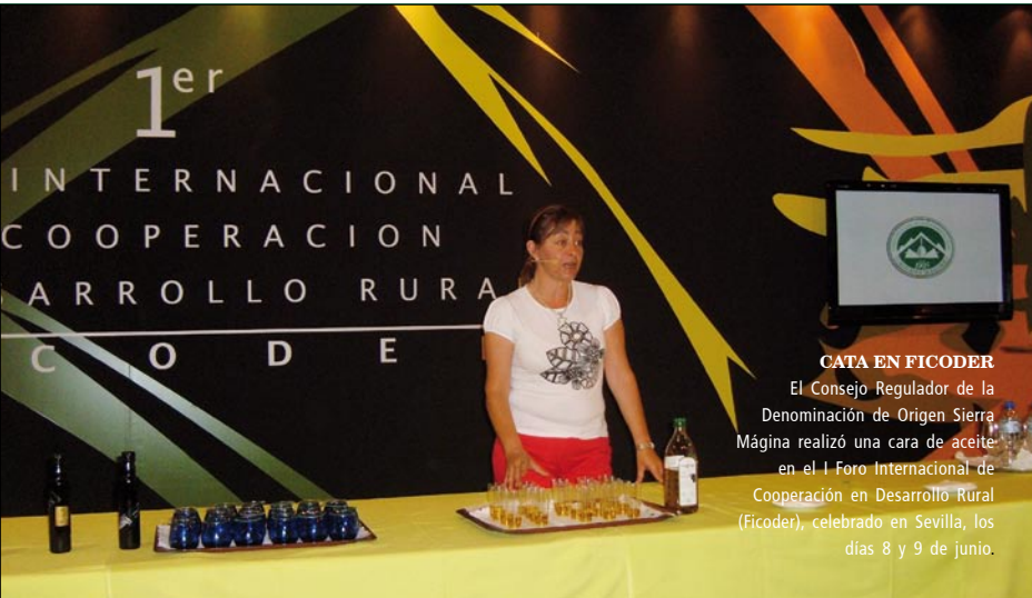
CATA EN FICODER El Consejo Regulador de la Denominación de Origen Sierra Mágina realizó una cata de aceite en el I Foro Internacional de Cooperación en Desarrollo Rural (Ficoder), celebrado en Sevilla, los días 8 y 9 de junio.